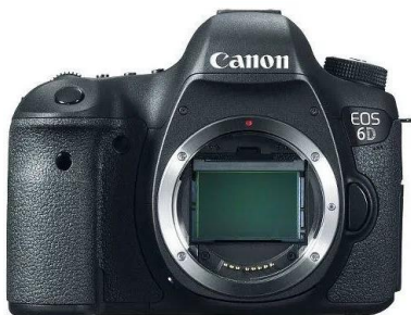
Фотоаппарат Canon EOS 6D Body