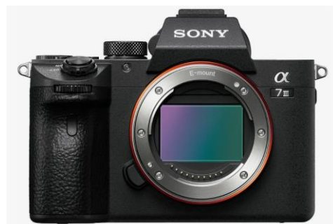
Фотоаппарат Sony Alpha ILCE-7M3 Body