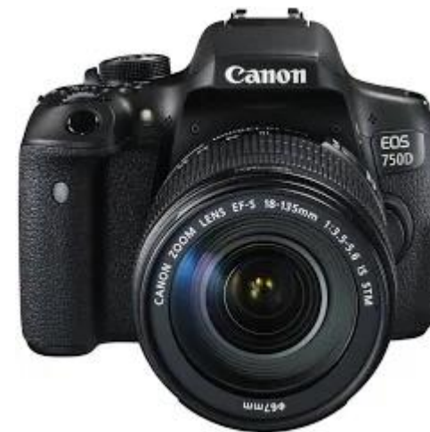
Фотоаппарат зеркальный Canon EOS 750D 18-135mm

При выборе камеры, читаем отзывы! И советуемся с теми, кто является обладателем.